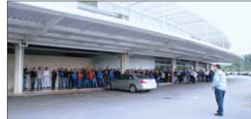
Eliseu em assembléia na Mahle

paga nesta quarta-feira (16). Os R$ 600,00 restantes serão pagos, de acordo com o cumprimento de metas, em março de 2010.