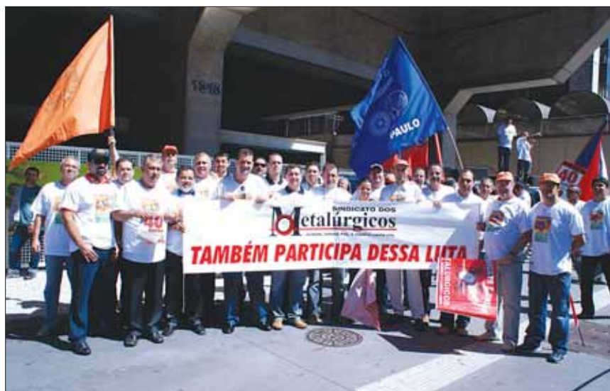
A diretoria do Sincicato em frente à Fiesp

Uma melhora já é sentida na atividade econômica e isso pode ajudar na luta por aumento real. E vamos usar isso nas negociações. Os trabalhadores deram a sua parcela para amenizar os efeitos da crise financeira global, como os acordos de redução de jornada de trabalho e salários fechados em vários setores na primeira metade do ano. Agora, como diz o lema da campanha, “É Hora de Conquistar”.