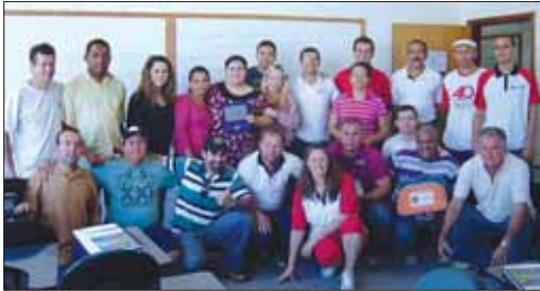
Os diretores e funcionários após a conclusão do curso

O Sindicato dos Metalúrgicos em parceria com a Faculdade INED esta proporcionando a todos os associados descontos significativos para os interessados em cursar uma faculdade. Essa parceria proporcionou aos diretores a possibilidade de fazerem dois cursos que nos dias de