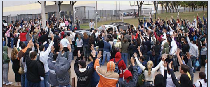
Os trabalhadores estão preparados para a luta

Depois de várias reuniões com a direção da empresa e muitas negociações, no dia 21 de agosto, os diretores do Sindicato realizaram uma importante assembleia na Compal, localizada no Distrito Industrial e que emprega mais de 700 trabalhadores que reclamavam que a empresa não pagava o piso salarial da categoria correto pelo número de empregados. O Sindicato negociou e ficou acertado que a correção já será feita em cima do mês de agosto. Sendo assim, todos os trabalhadores da Compal já começam a receber o piso de R$ 884,00. Outras reivindicações foram feitas, como plano de cargos e salários, fornecimento de cesta básica, adequação do convênio médico, resolver o problema do