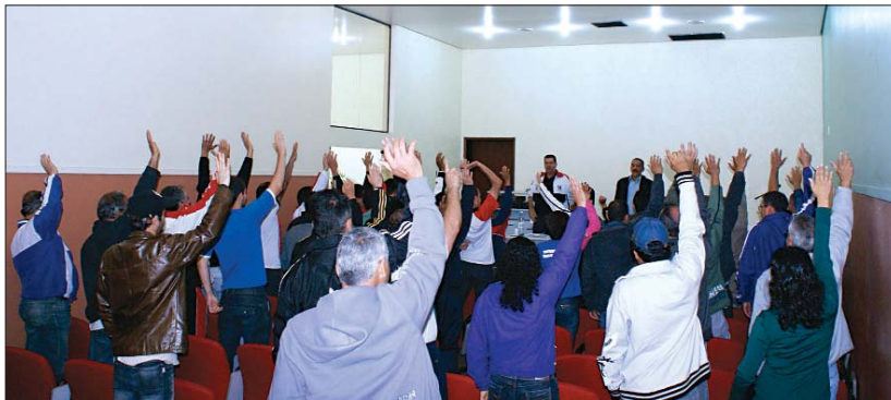
Os trabalhadores aprovaram a pauta em assembléia no Sindicato

Este é o recado que vamos dar para os patrões: não serão as dificuldades que vão nos colocar de