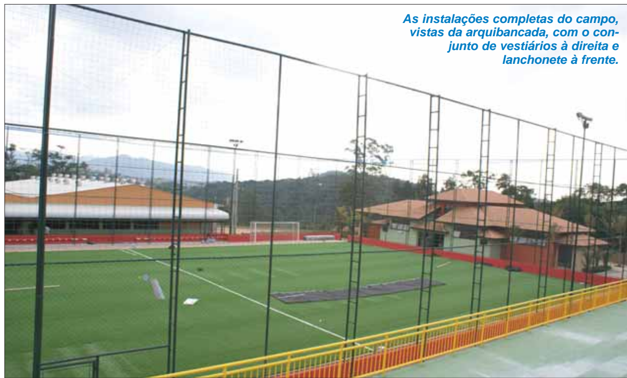
As instalações completas do campo, vistas da arquibancada, com o conjunto de vestiários à direita e lanchonete à frente.

Com a liberação da Alfândega, após a greve da Receita Federal, a grama do campo de futebol society do Clube chegou e já está em fase final de colocação. Todas as demais dependências também estão sendo finalizadas e a inauguração de mais este espaço aos nossos associados está programada para o dia 24 de agosto, com muita festa. Um festival também está sendo preparado para a data.