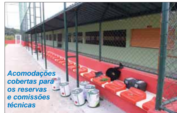
Acomodações cobertas para os reservas e comissões técnicas