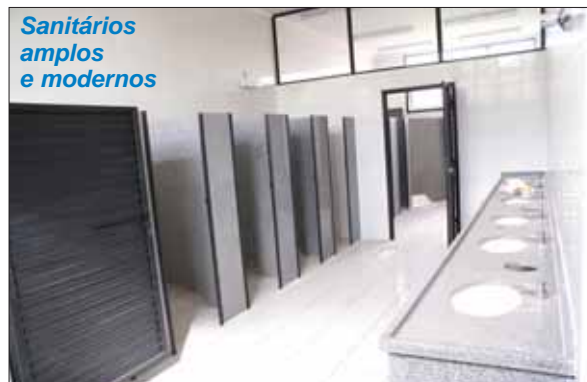
Sanitários amplos e modernos