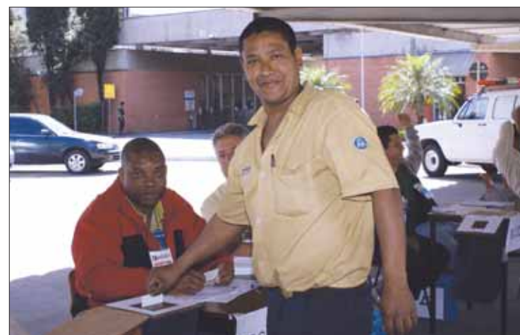
Nas fábricas, os trabalhadores participaram ativamente do processo (Nas fotos: Continental Teves e ThyssenKrupp)

que movimentou 150 pessoas, sendo que 100 vieram de sindicatos de metalúrgicos de outras regiões e outros dos sindicatos de Jundiaí. Não poderíamos deixar de agradecer ainda as pessoas de dentro das fábricas, dos Recursos Humanos, da segurança, portaria e de todos os setores que contribuíram para a realização da