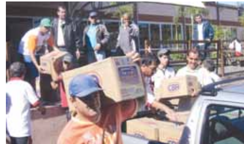
Retirada de alimentos no ano passado

Os não associados ao Sindicato tiveram de pagar ingresso na entrada, sendo que parte dessa arrecadação tem destino certo: ajuda aos necessitados atendidos por entidades assistenciais, que já fizeram os pedidos ao Sindicato. Muitos associados, que não tinham obrigação de pagar ingresso, também fizeram doações na portaria para contribuir com os carentes. Agora estamos adquirindo alimentos em cestas básicas que serão organizadas para doação.