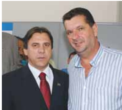
Ministro Marinho e Eliseu na inauguração da agência

Várzea Paulista já conta com uma agência da Previdência Social. Essa, por sinal, era mais uma das reivindicações do nosso Sindicato no sentido de melhorar o atendimento prestado em Jundiaí e desafogar o acervo de processos parados. É verdade que nossa contribuição, organizando arquivos, dando agilidade aos trabalhos e sendo referência, além da atuação de outros sindicatos, já fez com que a tramitação desses processos passasse a ser bem menos morosa, ganhando em agilidade, mas, mesmo assim, ainda está longe do ideal. A aber-