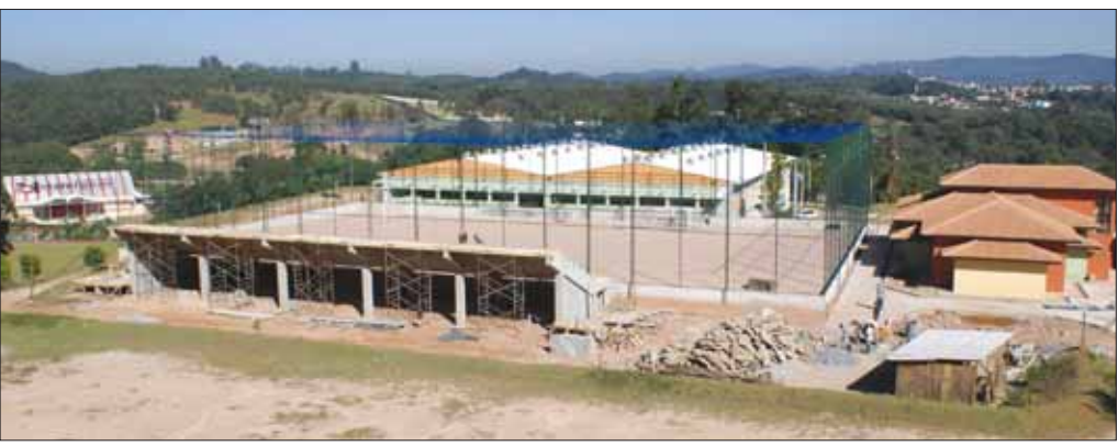
Obras no campo: arquibancadas, banheiros e vestiários

As obras do campo estão praticamente concluídas, faltando apenas o gramado. No total, são 2 mil metros de área, compreendendo, além do campo em dimensões oficiais (o maior da região), vestiários amplos e modernos, lanchonete e uma arquibancada com capacidade para 800 pessoas.