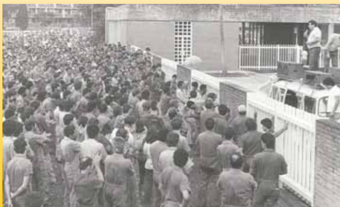
Krupp - arquivo Sindicato

Para refrescar a memória do pessoal da velha guarda e informar os mais jovens, é preciso lembrar da greve geral dos metalúrgicos de 1985 pela redução da jornada, que na época era de 48 horas semanais. Naquela ocasião, a categoria conseguiu firmar acordos para a redução da jornada para 44 semanais, que foi implantada de forma gradativa, e essa luta influenciou no debate no congresso nacional que estabeleceu o limite na Constituição Federal, em 1988.