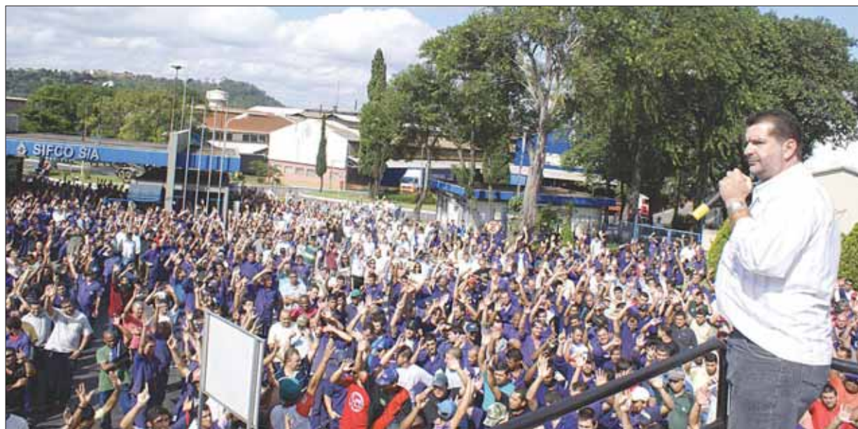
Trabalhadores da Sifco aprovaram a prorrogação da redução da jornada de trabalho

Por isso, precisamos analisar caso a caso, construindo alternativas conforme a situação de cada fábrica e setor, encontrando saídas negociadas que apontem para a manutenção do