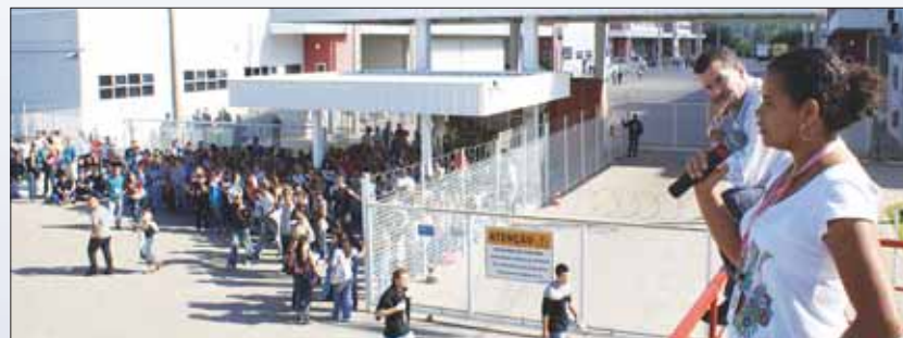
Os trabalhadores bateram o pé e garantiram descontos justos dos benefícios

Pelo negociado, não haverá alteração no desconto do transporte; o desjejum continuará sem