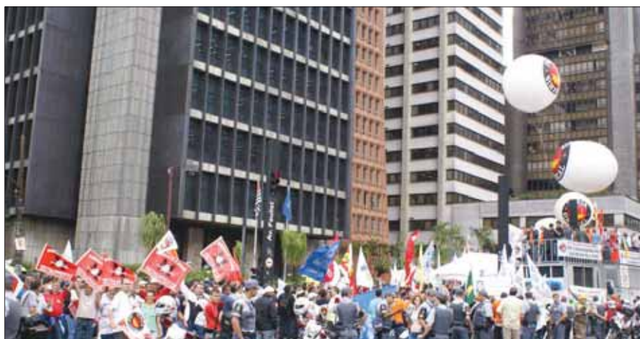
O protesto aconteceu em frente ao Banco Central

Metalúrgicos de Jundiá e região participaram na quarta-feira (21), em São Paulo, de uma manifestação organizada pelas centrais sindicais Força Sindical, CUT, UGT, CGT, CGTB e NCST, para exigir a redução na taxa básica de juros, a Selic. Cerca de 10 mil trabalhadores de todo o Estado se concentraram e saíram de três locais em direção ao Banco Central, na Avenida Paulista. Ato semelhante reuniu milhares de trabalhadores em diversos estados.